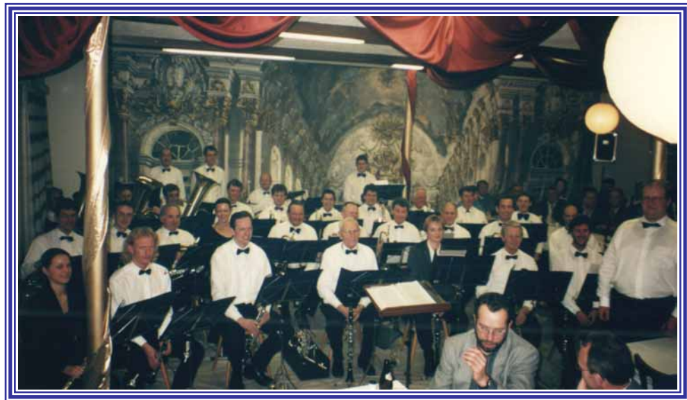
Konzert im Gasthof Schönbacher 1999 unter dem Motto "Strauss"

Den Höhepunkt des Jahres bildet das Wunschkonzert im Dezember beim GH Schönbacher. Der Musikverein bedankt sich auch hier für die große Unterstützung durch die Bevölkerung.