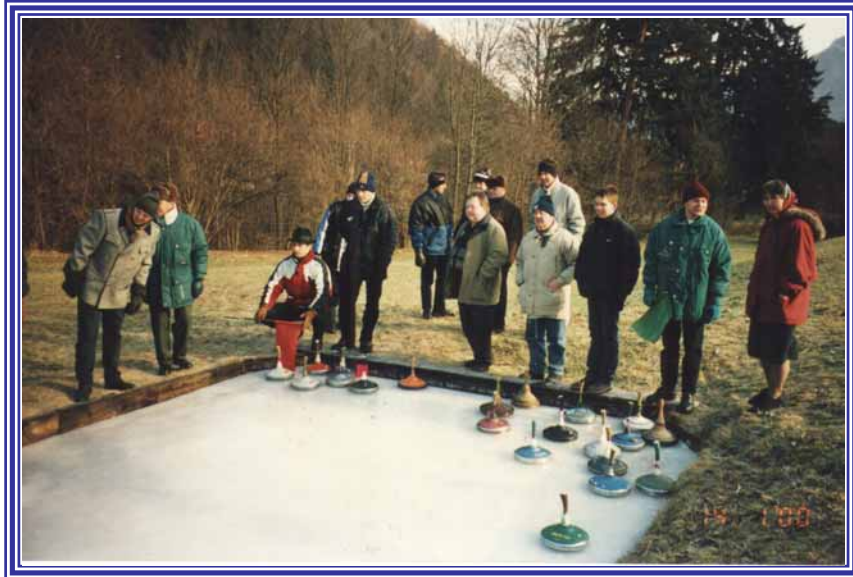
Eisschießen 2001 in der Gams

Ein Fixpunkt ist jedes Jahr das Eisschießen gegen den MV Pernegg. Gespielt wird dabei neben dem Essen und einem Getränk immer auch um den Wanderpokal, den jener Musikverein behalten darf, der als erster dreimal den Wettkampf gewinnt.