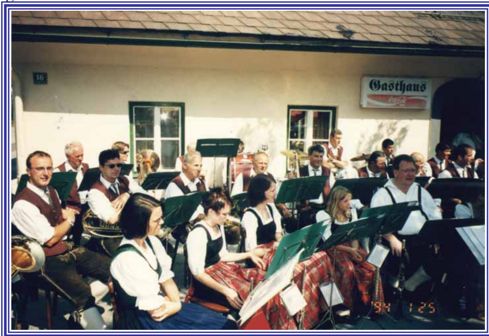
Konzert unter dem Motto "Jugend musiziert" 2002

Auch außermusikalische Aktivitäten werden in Zukunft durch unsere neue Jugendreferentin verstärkt gesetzt werden.