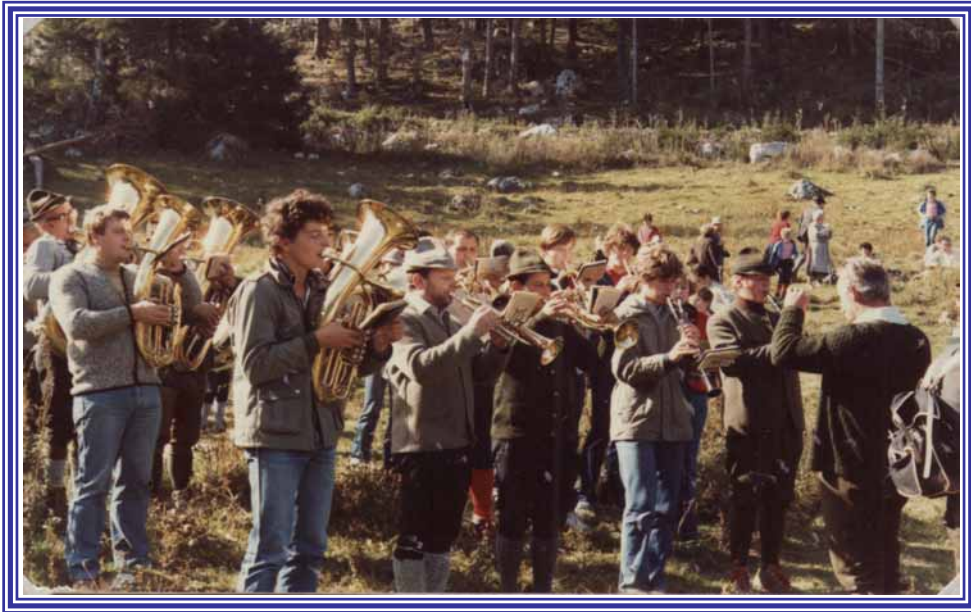
Bergmesse am Kreuzkogel 1981

Jedes Jahr wird auf dem Kreuzkogel über Röthelstein eine Bergmesse veranstaltet. Für die musikalische Umrahmung sorgt schon seit mehr als 20 Jahren der Musikverein.