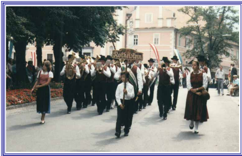
Bezirksmusikfest in Frohnleiten 1989

Auch beim alljährlichen Bezirksmusikertreffen nimmt der Verein regelmäßig aktiv Teil: