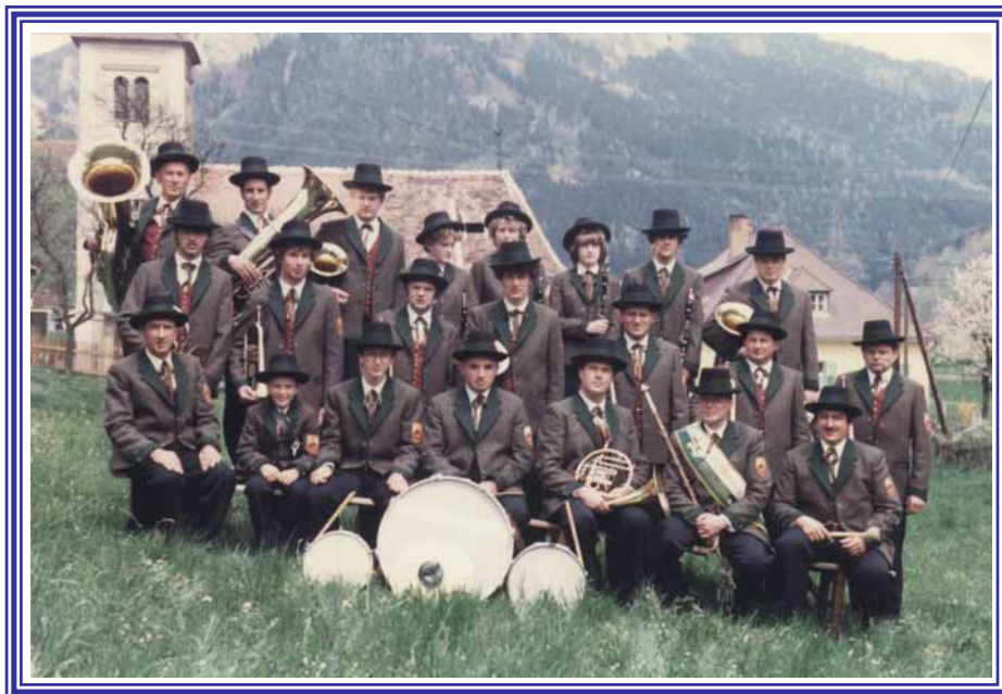
Gruppenfoto mit neuen Trachtenanzügen 1983; Musikerstand war 25

Höhepunkt der Vereinsgeschichte: Durchführung des Bezirksmusikerfestes in Verbindung mit dem 60-jährigen Gründungsfest. Teilnahme von ca. 1000 Musiker (Zeltfest auf der Kirchleitnerwiese).